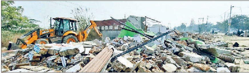
रेवाड़ी। रामगढ़ रोड पर बस स्टैंड की जमीन से 23 नवंबर 2023 को तोड़े गए मकान, सरकुलर रोड पर दौड़ते हुए इलेक्ट्रिक बस तथा पुराने बस स्टैंड परिसर में खड़ी बसें।