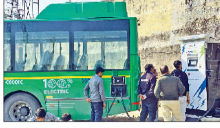
रेवाड़ी। बस स्टैंड में इलेक्ट्रिक बस की चार्जिंग करते हुए तथा 8 जुलाई को बावल से चंडीगढ़ के लिए एसी बस को रवाना करते विधायक।

वर्ष 2025 जनवरी में शहर में 5 इलेक्ट्रिक बसों की सौगात मिली। आगामी दिनों में पांच इलेक्ट्रिक बसें और मिलने वाली हैं। मुख्यमंत्री नाराज सैनी ने 26 जनवरी का बसों का हरी झंडी दिखाई। रोडवेज विभाग की ओर से इलेक्ट्रिक बसों को चार्ज करने के लिए बस स्टैंड परिसर में चार्जिंग स्टेशन बनाया गया। हालांकि मुख्य चार्जिंग स्टेशन रामगढ़ रोड पर बनने वाले नए बस स्टैंड पर ही बनाया जाएगा, लेकिन फिलहाल वहां अभी काम शुरू नहीं हुआ है। जनवरी में धरूहेड़ा व बावल स्टूट पर इलेक्ट्रिक बसों की शुरुआत की गई थी। लेकिन बाद में धरूहेड़ा स्टूट का यात्री संख्या कम होने के कारण बंद करना पड़ा।