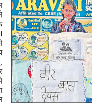
महेंद्रगढ़। कार्यक्रम में अपनी प्रस्तुति देती छात्रा।